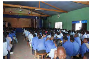
Salle de spectacle