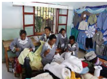
Atelier de broderie