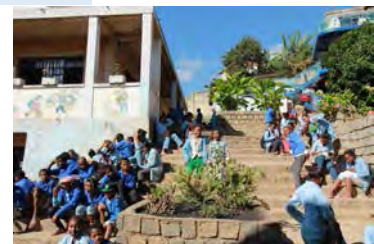
Vue générale des bâtiments