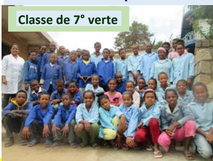
Classe de 7° verte