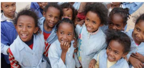
Association SETAM, pour la scolarisation des enfants démunis et de la rue à l'Ecole de l'Espoir située à Tsiadana (Tanarive)

Bravo et félicitations à nos bénévoles Inscrivez-vous sur nos listes pour la prochaine expo du 30 nov au 10 décembre contact@setam-auray.org ou 02 97 56 41 30